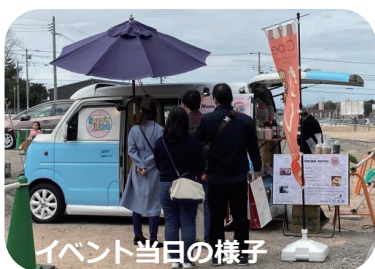
イベント当日の様子